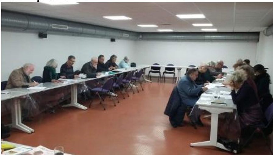
Souvenirs de l'AG de Janvier 2020

- le Samedi 23 Janvier à 16h en visioconférence Assemblée Générale annuelle d'Espaces Marx Aquitaine